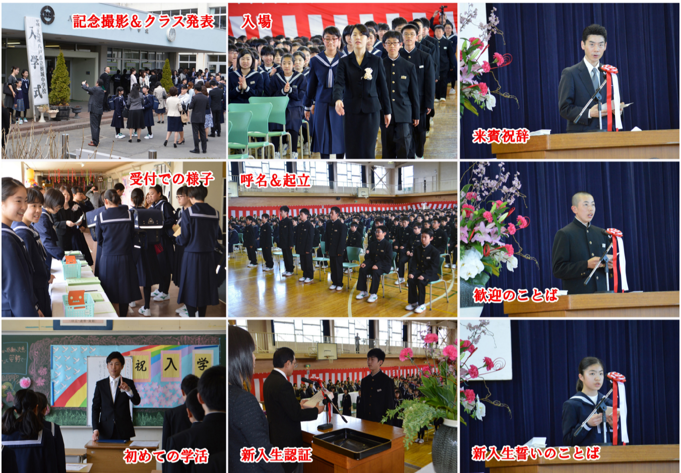
記念撮影&クラス発表 入場

第30号 平成29年4月26日 編集・発行 八戸市立根城中学校 電話 0178-22-2065 文責 中嶋正喜 心の瞬発力 キャリア教育 プラス1 根城の名を上げる